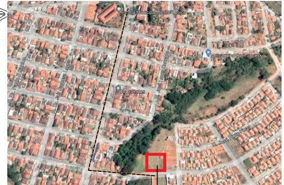
LOTES DE IMPLANTAÇÃO